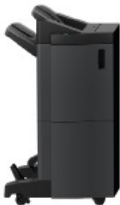
Finalizador de brochuras