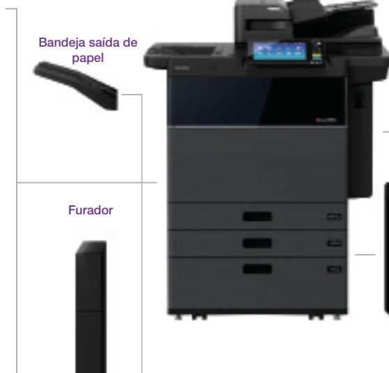
Bandeja saída de papel